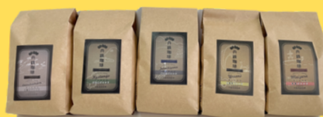
丹鉄咖啡 豆 (5种) 各1,400日元