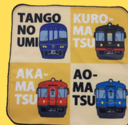
毛巾手帕 (观光火车) 700日元