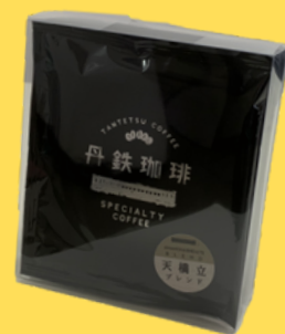
滴水袋套装(5片) 900日元