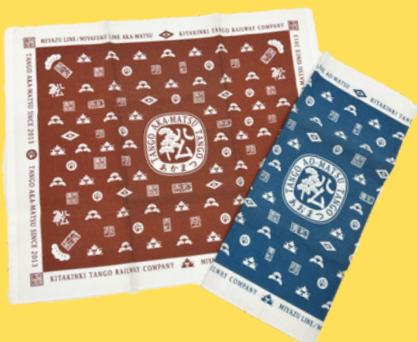
日本毛巾手帕(红・蓝) 各550日元